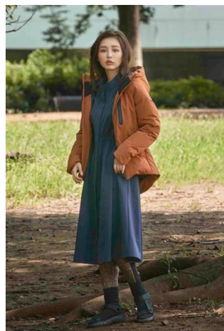
ストレッチシャツワンピー ス(¥7,990+税)