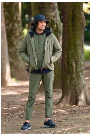
撥水防風機能ダウンジャケ ット(¥14,990+税)

「TIGORA / BEAMS DESIGN」は機能性を持ちながらもスポーツや日常シーンなど様々なシーンに合わせやすいBEAMS DESIGNらしいスタイリッシュな商品を揃えています。秋冬コレクションでは、日常生活レベルの撥水機能や高度な防風機能も持っており、真冬であっても、アウトドアを含めたあらゆるシーンで使える撥水防風機能ダウンジャケットやストレッチ性が高く機能的なストレッチシャツワンピース、ドライサーマルマキシワンピースなども展開します。