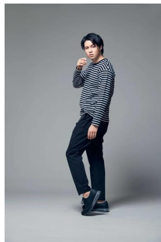
ストレッチクライミングパン ツ(¥4,990+税)