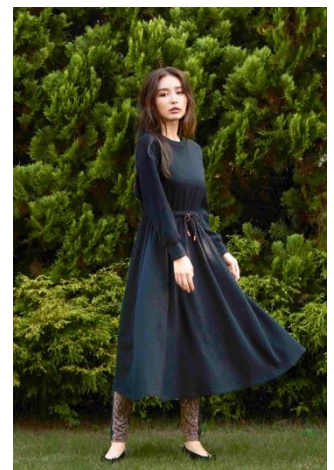
ドライサーマルマキシワン ピース(¥5,990+税)