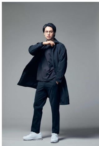
DELITE ステンカラーコート (¥9,990+税)

「ULTIMATE」は、TIGORAの機能性をふんだんに盛り込み、スポーツ、アウトドアシーンでも活躍する高い機能性を実現させた商品を揃えています。秋冬コレクションでは、暖かい空気をため込む中空糸を使用し高保温性を保ちながらも圧倒的な薄さと軽さを実現しているDELITE®（デライト）素材を使用したロングジャケットやステンカラーコートを展開。通常のポリエステル中綿と比較し、目付は約3割軽く、厚みは約3倍、保温性は約1.5倍、通気性は約2.5倍とどの項目でも高い機能性を持っています。メンズステンカラーコート（Lサイズ）に関しては、わずか540グラムという軽さを実現しています。また、「SMART」でも採用しているアルミ蓄熱機能によるコートのほか、高いストレッチ性や軽量化を実現したパンツやワンピースも展開いたします。