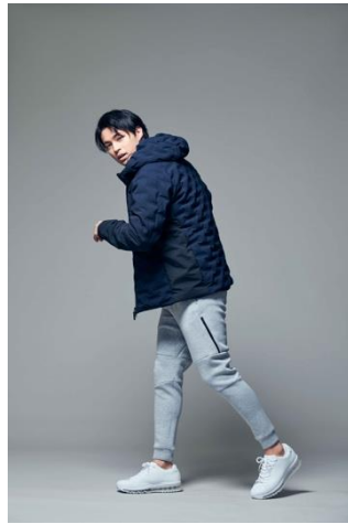
テックスウェットジョガーパ ンツ(¥3,990+税)