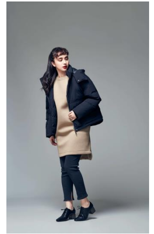
テックスウェットワンピース (¥4,990+税)