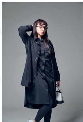
撥水軽量中綿ノーカラーロングコート(¥8,990+税)