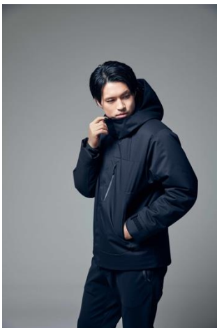
アルミ蓄熱パデットジャケット (¥13,990+税)