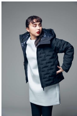
アルミ蓄熱フードジャケット (¥7,990+税)