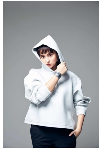
テックスウェットパーカー (¥3,990+税)