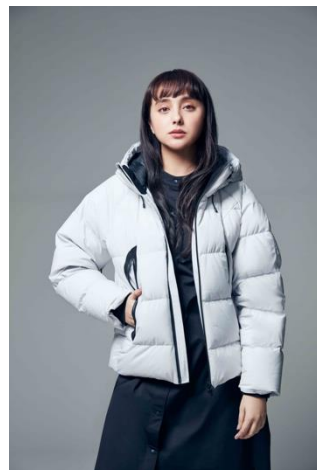
アルミ蓄熱フードダウンジャケット(¥19,990+税)