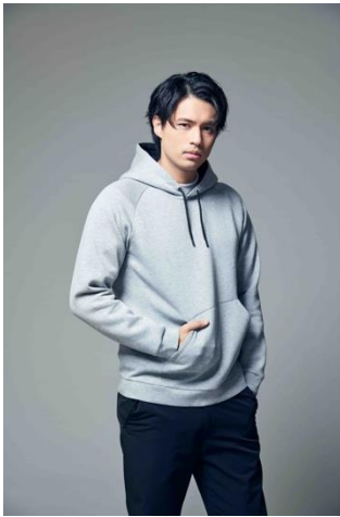
テックスウェットパーカー (¥3,990+税)