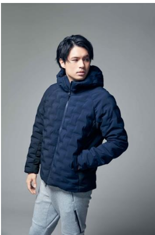
アルミ蓄熱フードジャケット (¥7,990+税)