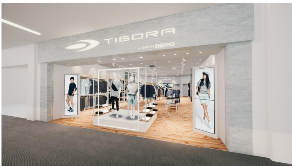
「TIGORA by SPORTS DEPO」ららぽーと立川立飛店イメージ

アパレルウェアや小物を中心に、日常からスポーツシーンまでご活用いただける様々なアイテムを揃えています。また、今回大型ショッピングセンター内で展開することにより、スポーツを楽しむ方だけでなく、より幅広い方々に日常でもお使いいただけるライフスタイルアパレルを提供できる場となっています。