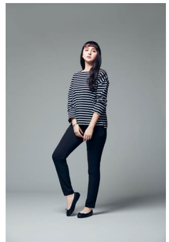
ストレッチスキニーパンツ (¥4,990+税)