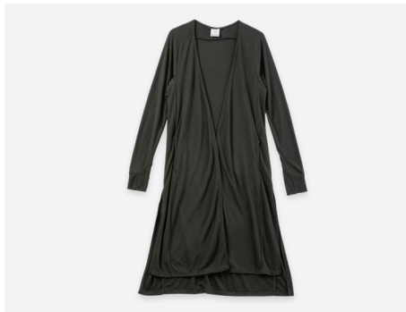
ロングカーディガン : 3,990円+税 UVカット・吸汗速乾