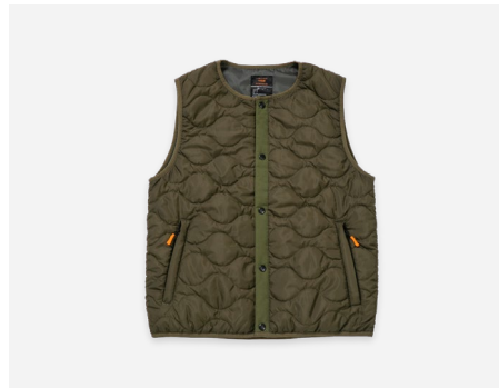
キルティングベスト : 4,990円+税 撥水