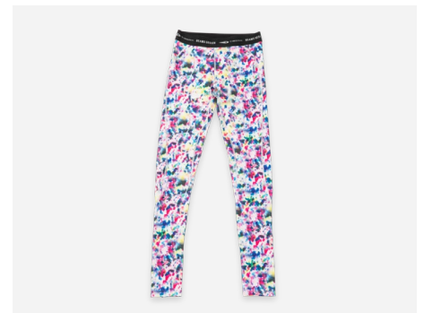
ロングタイツ : 3,490円+税 UVカット・吸汗速乾・ストレッチ