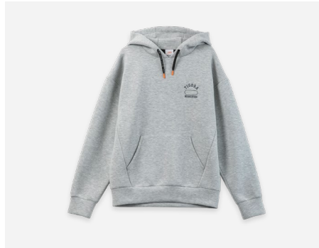
テックスウェットプルオーバーパーカ : 5,990円+税 吸汗速乾・ストレッチ