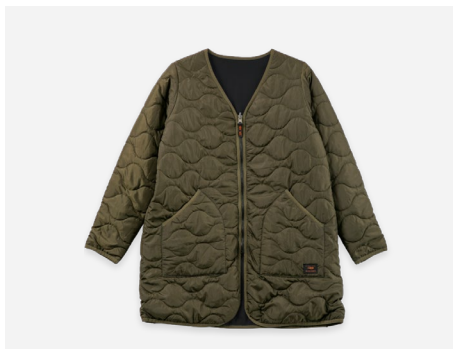
リバーシブルコート : 7,990円+税 撥水