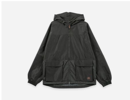
マウンテンジャケット : 8,990円+税 撥水・防風