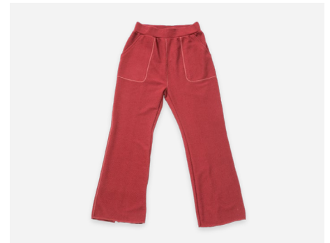
サーマルスリットパンツ : 4,490円+税 UVカット・吸汗速乾