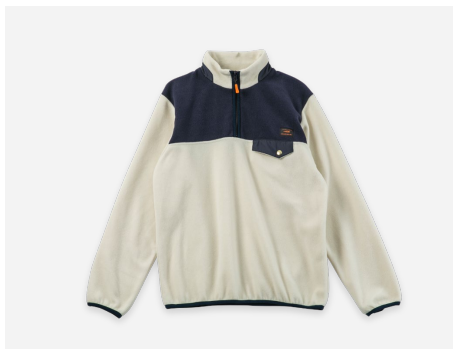
ハーフジップフリース : 5,990円+税 保温