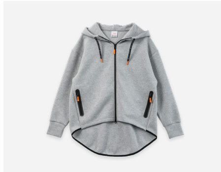
ジップアップパーカ : 5,990円+税 UVカット・吸汗速乾・ストレッチ