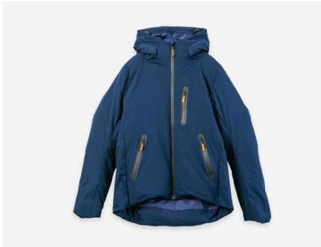
ダウンジャケット : 14,990円+税 撥水・防風