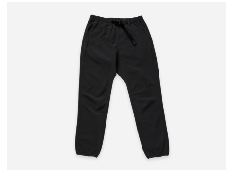
フリースパンツ : 4,990円+税 保温