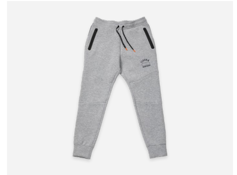
テックスウェットパンツ : 5,990円+税 吸汗速乾・ストレッチ