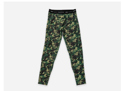
ロングタイツ : 3,490円+税 吸汗速乾・ストレッチ