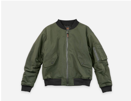
MA-1 : 6,990円+税 撥水