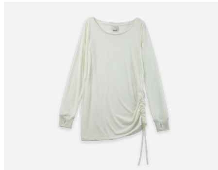
チュニックTシャツ : 2,990円+税 UVカット・吸汗速乾