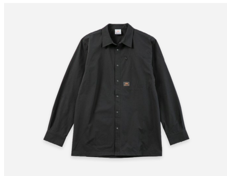
ストレッチシャツ : 4,990円+税 撥水・ストレッチ