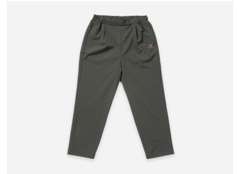
ストレッチパンツ : 4,490円+税 ストレッチ・UVカット・吸汗速乾