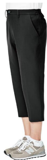
CROPPED TAPERED FIT