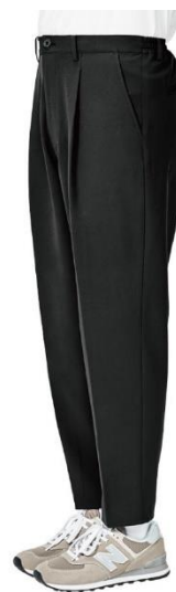
WIDE TAPERED FIT