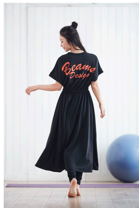
バックロゴワンピース (¥3,990) / ランニングタイツ (¥3,490)