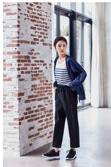
ボーダー半袖Tシャツ (¥2,990) / ストレッチカプリパンツ (¥4,490)