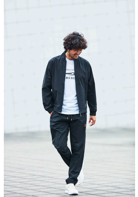
半袖Tシャツ (¥2,990) / 布帛ジャ ケット (¥5,990) / 布帛ストレ ッチロングパンツ (¥4,990)