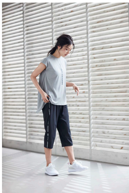
フレンチスリーブTシャツ (¥2,990) / カプリパンツ (¥3,490)