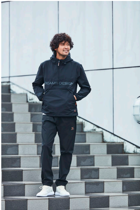
布帛PULL-OVER (¥5,990) / 布帛 ストレッチロングパンツ (¥4,990)