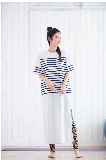
ボーダーワンピース (¥3,490) / ロングタイツ (¥3,490)