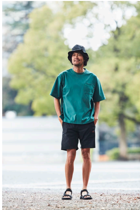
半袖Tシャツ (¥3,490) / 7 ポケッ トベンチレーションパンツ (¥4,990)