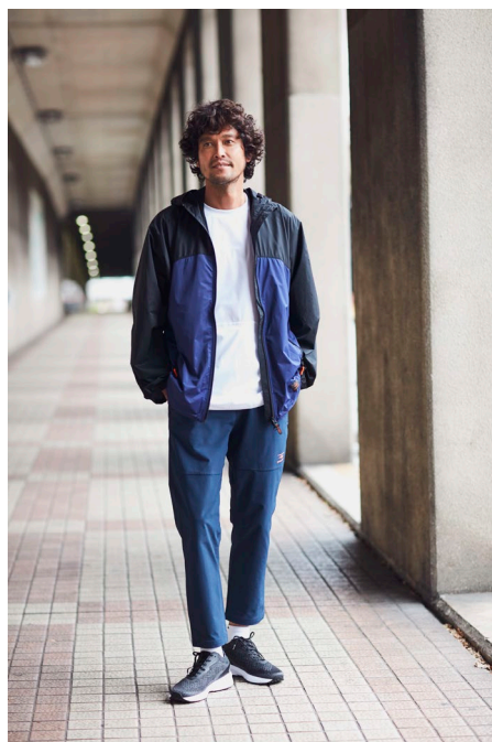
布帛Tシャツ (¥3,490) / パッカブ ル布帛ジャケット (¥6,990) / 布 帛ストレッチロングパンツ (¥5,990)