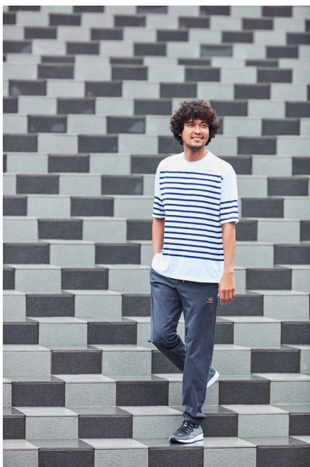
半袖Tシャツ (¥2,990) / 布帛スト レッチロングパンツ (¥4,990)