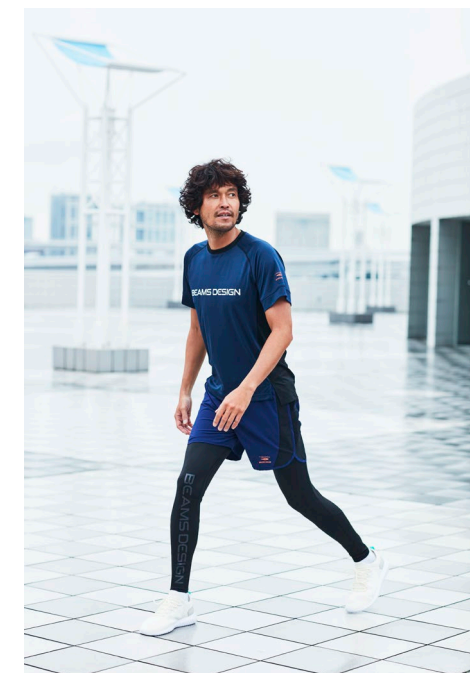
半袖Tシャツ (¥2,990) / 布帛スト レッチショーツ (¥3,490) / タイ ツ (¥3,490)