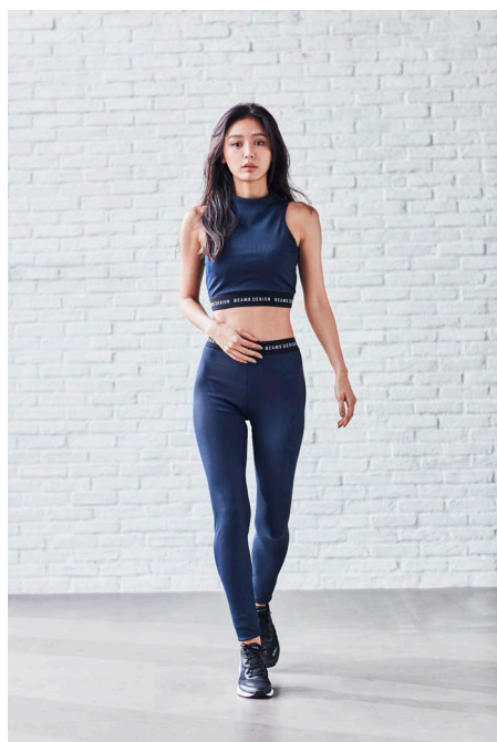
ハイネックブラトップ (¥2,990) / ヨガタイツ (¥3,490)