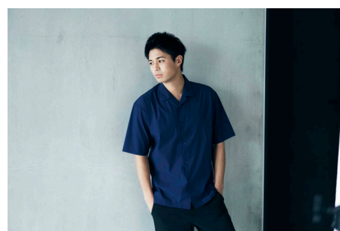
ストレッチシャツ (¥3,990+税)