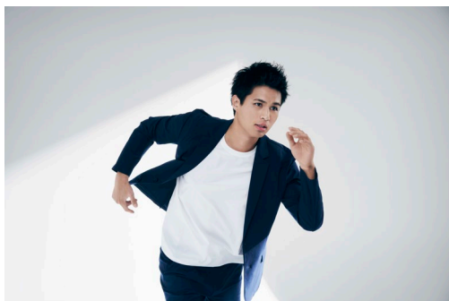
ストレッチTシャツ (¥2,990+税)