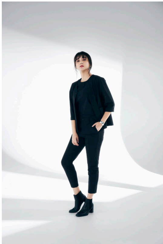
ストレッチカーディガン (¥3,990+税) ／ストレッチTシャツ (¥2,990+税) / ストレッチテーパードパンツ (¥4,990+ 税)