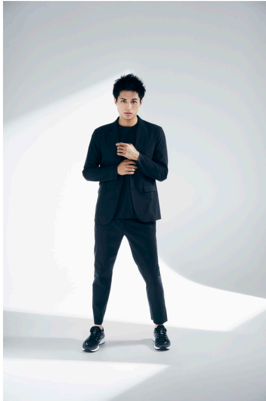
ストレッチテラードジャケット (¥5,990+税) /ストレッチビッグTシ ャツ (¥2,990+税) /ストレッチテー パードパンツ (¥4,990+税)