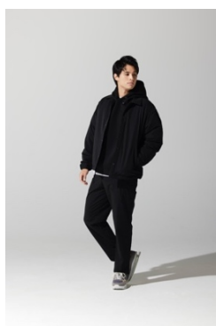
デライトパディットコーチジャケット(¥10,989)