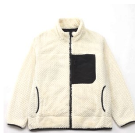
アルミボアフリースジャケット (¥5,489)