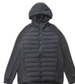
サーモライト ハイブリッドパディットジャケット (¥7,689)