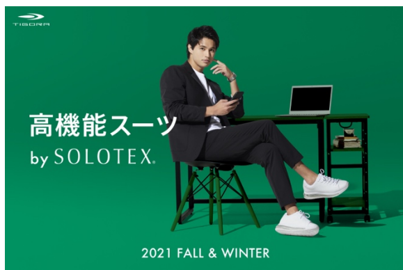
テーラードジャケット (¥7,689) テーパードパンツ (¥5,489)

2021 年秋冬コレクションでは、人気を博した素材の商品バリエーションを増やし、パワーアップしました。まず、2019 年の販売当初から好評で、累計販売 8 万本の実績をもつスマートパンツと同素材の SOLOTEX® をテーラードジャケットにも採用し、新発売。パンツとセットアップで着用可能になり、SOLOTEX® の優れたストレッチ性やソフトな肌触りをスーツで体感いただけます。また、昨年の秋冬コレクションでヒットした、ダンボールスウェット素材による「TECH SWEAT シリーズ」には、ジャケットやパンツ、ワンマイルウェアとして着られるワンピースなどを追加。同等の肉厚素材と比較して 10% も軽量性に優れている一方、高い保温性を実現。程よい肉厚とハリ感のある生地のため、スウェットながらもきれいなコーディネートで着こなしていただけます。