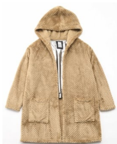
アルミシャギーフリースロングカーディガン(¥5,489)