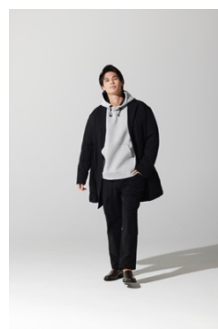
チェスターコート(¥14,289)