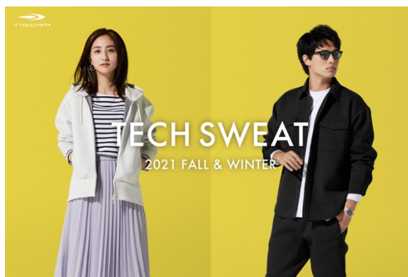
左：テックスエットフルジップパーカ (¥4,489)