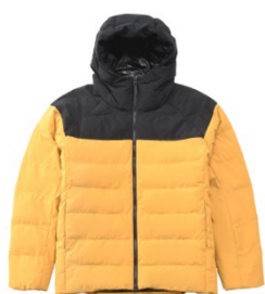
アルミパディットフードジャケット (¥7,689)