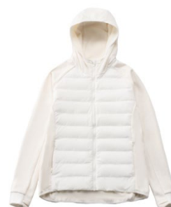
サーモライトパディットジャケット(¥7,689)