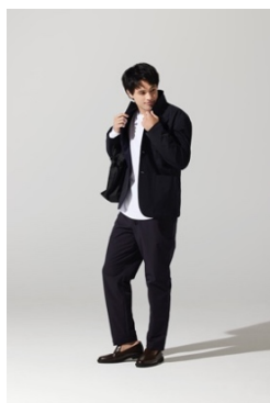
デライトテラーコートジャケット(¥9,889)

本コレクションからは、人気の SOLOTEX®と、暖かい空気をため込む中空糸で優れた軽量性と保温性をもつ素材、DELITE®を、表と裏地で分けて使用したハイブリッド素材のスーツが新たに発売。両素材を合わせることで、暖かいのに軽く、そして伸縮性もある着心地抜群のスーツを実現。スーツ以外にもチェスターコートの販売も予定しており、寒い冬でもスマートでおしゃれに過ごしていただけます。