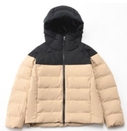
アルミパディットフードジャケット(¥7,689)