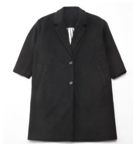
アルミテラーコート(¥10,989)