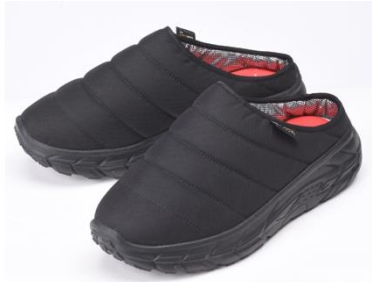
アルミ蓄熱モック ¥ 3,839