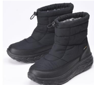
アルミ蓄熱ブーツ ¥ 4,389