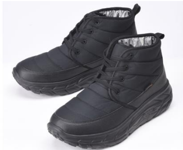
アルミ蓄熱チャッカ ¥ 4,389