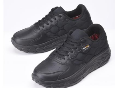
アルミ蓄熱スニーカー ¥ 4,389