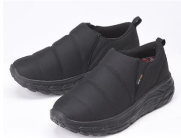
アルミ蓄熱スリッポン ¥ 3,839