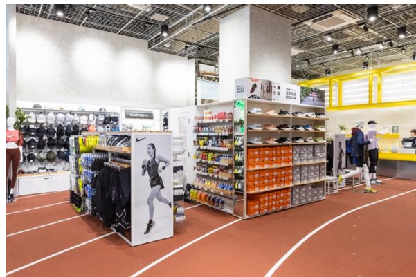
人工芝を用いたサッカーコーナーや国立競技場のタータンを使用したランニングシューズ試着スペース (画像はイメージです)