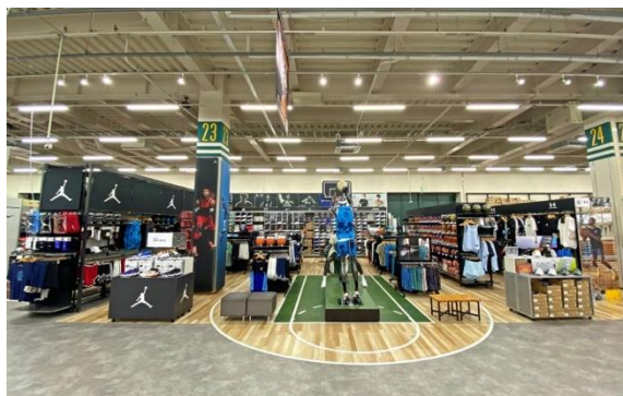
臨場感溢れるバスケットコートが描かれたフロアとプレー中をイメージさせるマネキン (画像はイメージです)