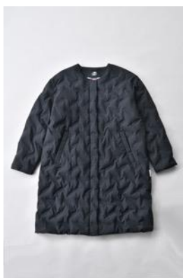
アルミ蓄熱パデットノーカラージャケット THERMOLITE (R) 使用/ブラック