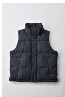
アルミ蓄熱パデッドベスト THERMOLITE (R) 使用/ブラック