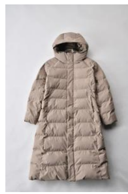
アルミ蓄熱パデットロングコート THERMOLITE (R) 使用/キャメル