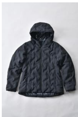
アルミ蓄熱パデッドフードジャケット THERMOLITE (R) 使用/ブラック