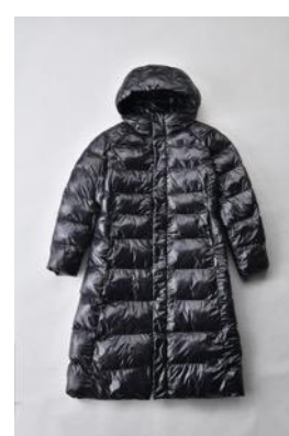
アルミ蓄熱パデットロングコート THERMOLITE (R) 使用 光沢/ブラック