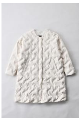
アルミ蓄熱パデットノーカラージャケット THERMOLITE (R) 使用/クリーム