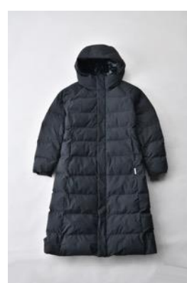
アルミ蓄熱パデットロングコート THERMOLITE (R) 使用/ブラック