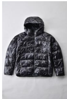
アルミ蓄熱パデッドフードジャケット THERMOLITE (R) 使用 光沢/ ブラック