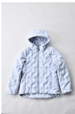
アルミ蓄熱パデッドフードジャケット THERMOLITE (R) 使用/ グレイッシュブルー