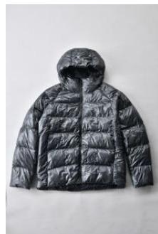
アルミ蓄熱パデッドフードジャケット THERMOLITE (R) 使用 光沢/ チャコールグレー