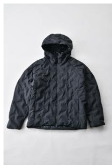
アルミ蓄熱パデッドフードジャケット THERMOLITE (R) 使用/ブラック