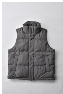
アルミ蓄熱パデッドベスト THERMOLITE (R) 使用/カーキ

ベスト、ジャケット、ロングコートの3型で、ジャケットには通常の色合いのほか、杢素材のチャコールグレーと光沢素材のチャコールグレー、ブラックが登場します。