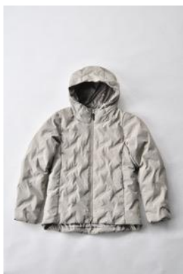
アルミ蓄熱パデッドフードジャケット THERMOLITE (R) 使用/サンド

フードジャケット、ノーカラージャケット、ロングコートの3型で、ロングコートには通常のカラーのほか、光沢素材のブラックが登場します。