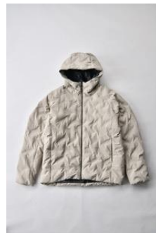
アルミ蓄熱パデッドフードジャケット THERMOLITE (R) 使用/サンド