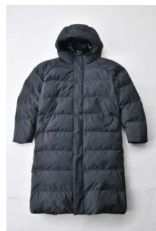
アルミ蓄熱パデッドフードロングコート THERMOLITE (R) 使用/ブラック