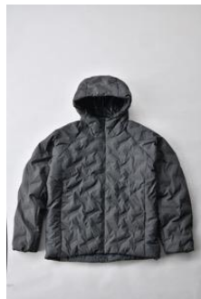
アルミ蓄熱パデッドフードジャケット THERMOLITE (R) 使用/カーキ