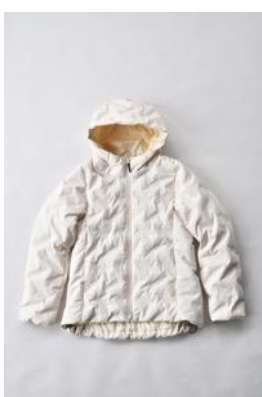
アルミ蓄熱パデッドフードジャケット THERMOLITE (R) 使用/クリーム