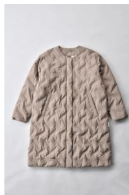
アルミ蓄熱パデットノーカラージャケット THERMOLITE (R) 使用/キャメル