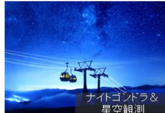
ナイトゴンドラ& 星空観測