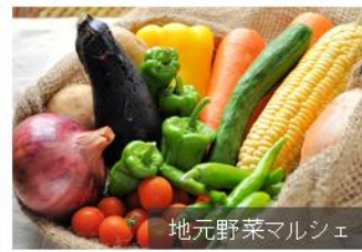
地元野菜マルシェ