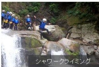
シャワークライミング