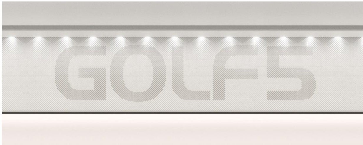
ゴルフボールを再利用したエントランス GOLF 5 ロゴ

1 階ゴルフ 5 フラッグシップストアのエントランスにある巨大な GOLF 5 ロゴは廃棄予定のゴルフボールを約 2,000 個（4,000 ピース）使用しています。同じくレジ会計時にちょっとした荷物やかばんなどを置いておけるゴルフボール再利用什器なども設置しています。