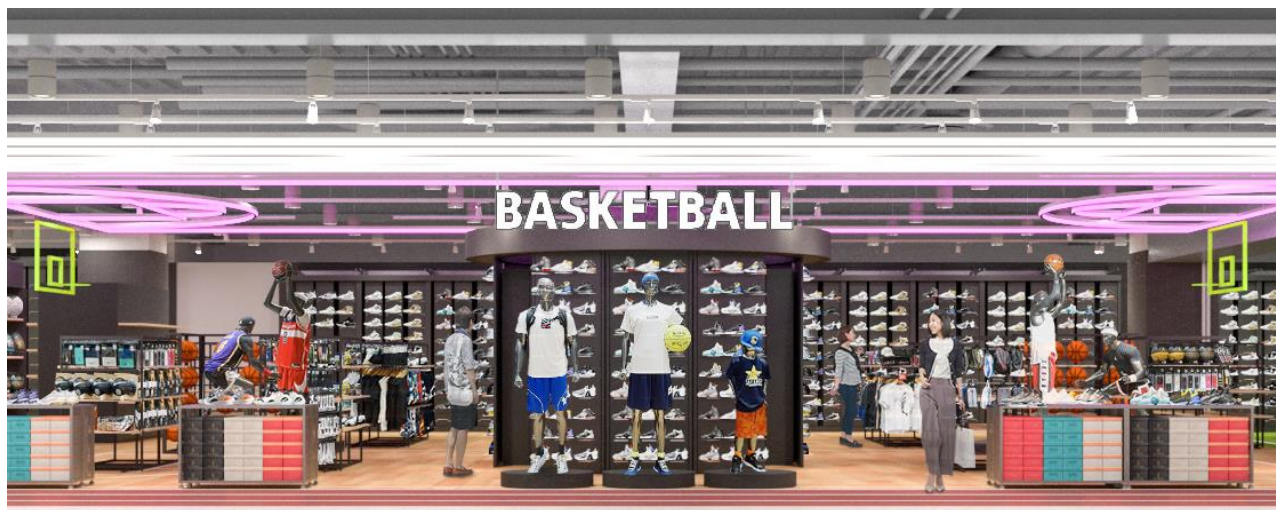
D) NBA コートと同素材のホワイトアッシュ フローリング材を採用したバスケットボールコーナー