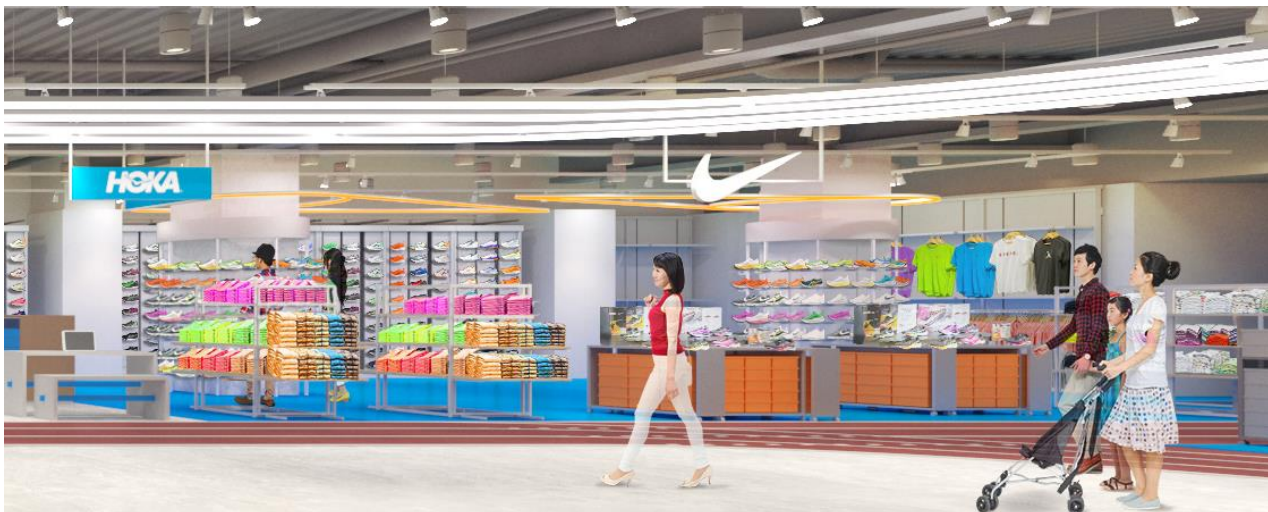
A) 世界陸上連盟公認陸上競技用舗装材を使用したランニングコーナー

本物のマテリアルにこだわった臨場感溢れる売場空間を再現しました。実際のプレーシーンの熱気を感じられるような世界観の中でお買い物を楽しむことはもちろん、各種シューズなどの使用感を体感することができます。