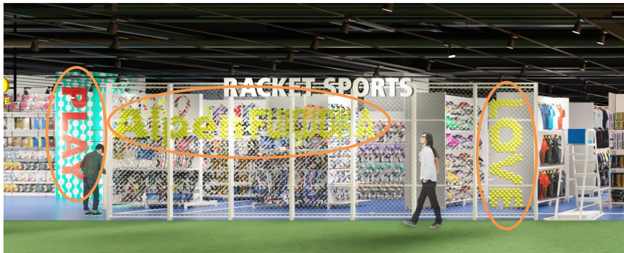
テニスボール・卓球ラケットを再利用した店内装飾

3階スポーツデポフラッグシップストアでは、ラケットスポーツコーナーに設置してあるAlpen FUKUOKAロゴにはテニスボールを再利用、卓球コーナーの装飾にも卓球ラケットを再利用しています。また、野球コーナーに設置してある印象的な選手の装飾にはバットを再利用するなど、サステナブルへの取り組みとしてはもちろん、お客様に楽しんでいただきながらお買い物をしていただけるような工夫を随所に展開して参ります。