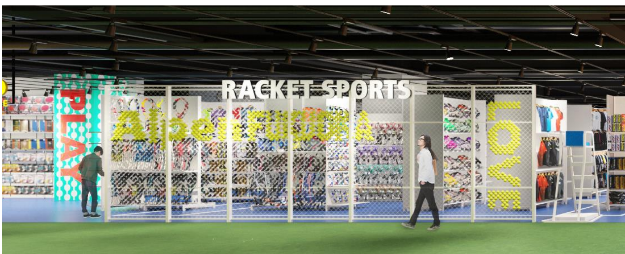
C) ITF（国際テニス連盟）公認テニスコート材を採用したテニスコーナー