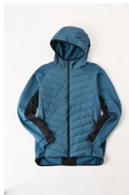
ハイブリッドインサレーションジャケット (メンズ) 6,999 円 (税込)