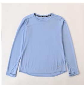
ランニング UPF50+長袖 T シャツ (レディース) 2,499 円 (税込)