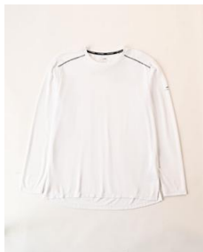
ランニング UPF50+長袖 T シャツ (メンズ) 2,499 円 (税込)