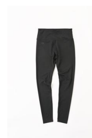
ランニングロングタイツ (レディース) 1,999 円 (税込)