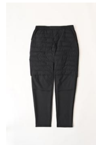
ハイブリッドインサレーションロングパンツ (メンズ) 5,999 円 (税込)