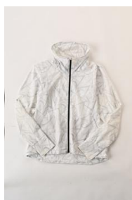
ランニングウインドジャケット (レディース) 4,999 円 (税込)