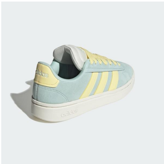
きつすぎずゆるすぎない着用感の レギュラーフィット