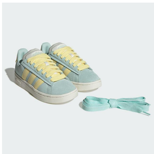
アレンジを楽しめる色違いの 2本のシューレースがセット