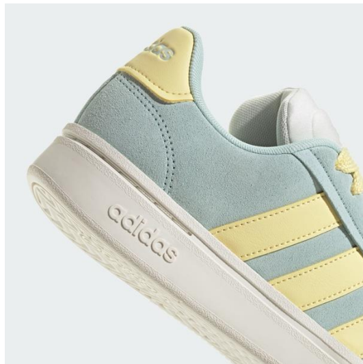
まるで雲の上を歩いているような Cloudfoam ミッドソール