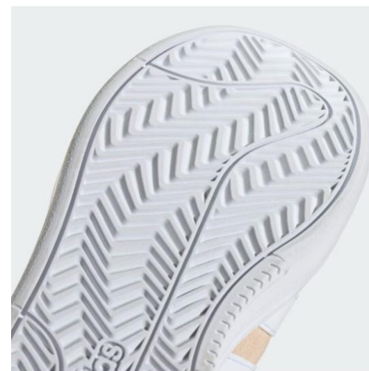
屈曲性に優れたラバーアウトソール