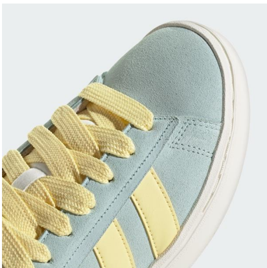
特徴的な太めのシューレース