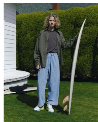
SHIRT ¥11,990 LONG TEE ¥5,999 WIDE PANTS ¥6,999