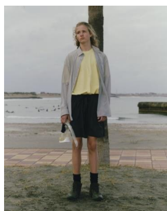
SHIRT ¥9,999 GARMENT DYED TEE ¥4,999 SHORTS ¥7,999