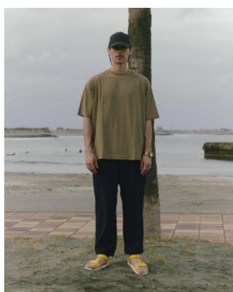
TEE ¥4,999 TRACK PANTS ¥9,999 CAP ¥3,999