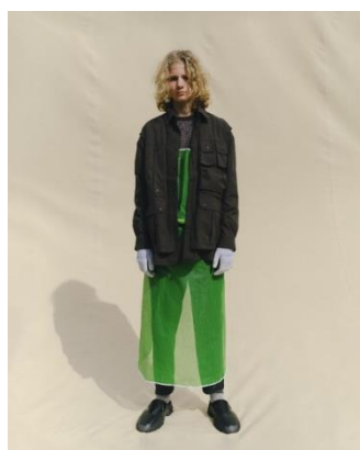
SHIRT ¥20,990 LONG TEE ¥5,999 TAPERED PANTS ¥8,999