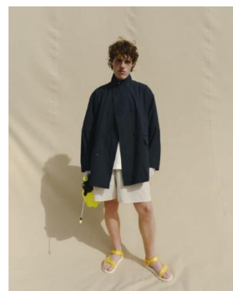
JACKET ¥16,990 TEE ¥4,999 SHORTS ¥6,999