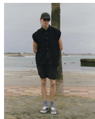
SHIRT ¥10,990 TEE ¥3,999 SHORTS ¥7,999 CAP ¥3,999