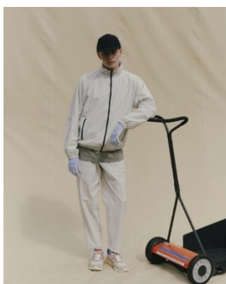
JACKET ¥14,990 LONG TEE ¥5,999 TAPERED PANTS ¥8,999 CAP ¥3,999