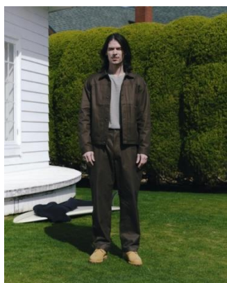
BLOUSON ¥18,990 LONG TEE ¥5,999 SUSPENDERS PANTS ¥14,990