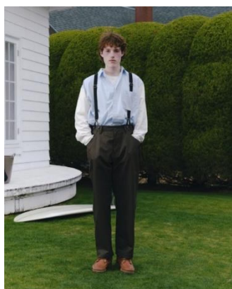
SHIRT ¥11,990 TEE ¥5,999 SUSPENDERS PANTS ¥14,990