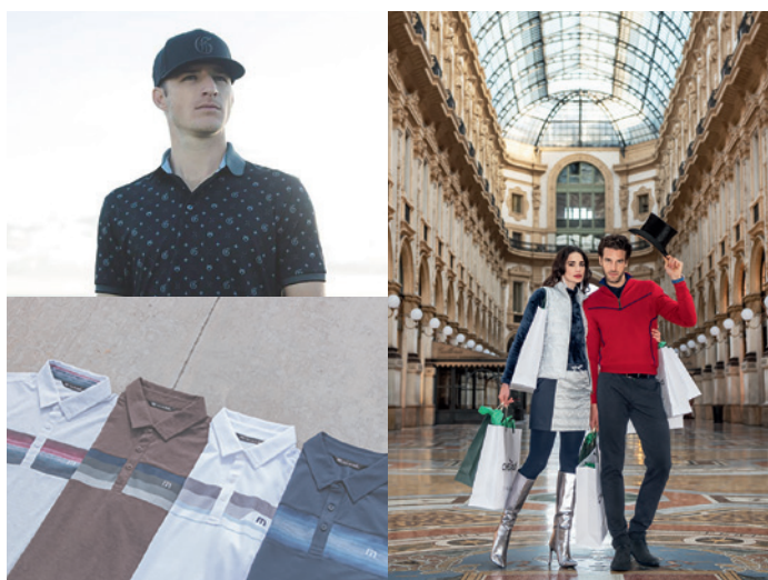
高級ゴルフアパレルブランドが勢揃い

トラビスマシューのショップインショップを備えるほか、グレイソン、キャロウェイアパレルセレクトライン、シェルボ、セントアンドリュース、ニューバランス、などアパレルのラインナップも非常に充実。国内取り扱いの極めて少ないレアブランドも展開し、「他にはない」ウェアが手に入る店舗として訴求していきます。