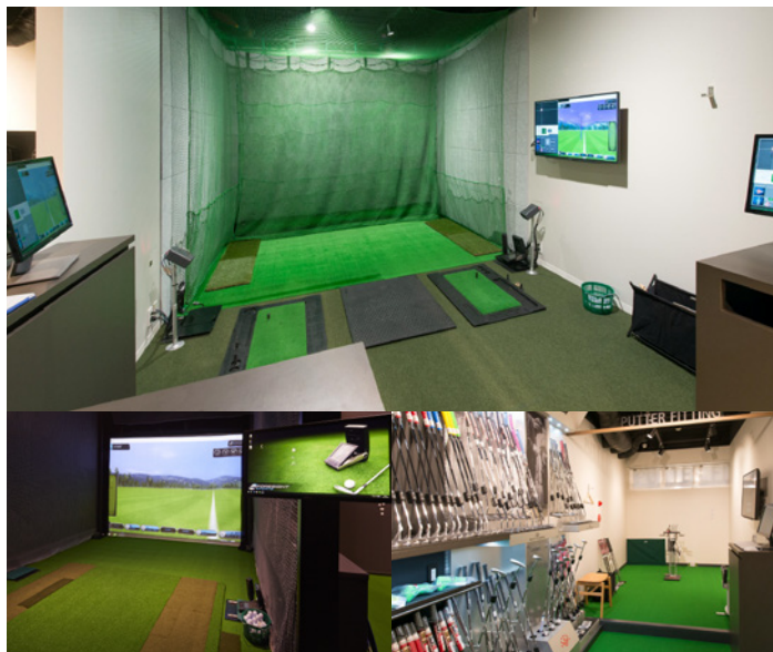
スペシャルルームは全国初の試みで、完全予約制

各種計測器を備えた個室の試打室は3室。その中の一つにはアパレルやパターまですべてのフィッティングができるスペシャルルームを設置。従来のフィッティングの常識を覆すラグジュアリーな空間をご提供できます。最新のフィッティングシステムが揃い、ハード・ソフト両面からお客様のあらゆるニーズに完璧にお応えします。