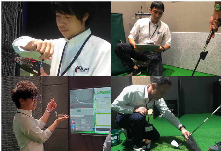
さまざまなメーカーのフィッター資格を持ったスタッフがフィッティングを行う

フィッティングルームでは、ドライバーやウッド類、アイアンはもちろん、ウェッジやパターまですべてのクラブをフィッティングできます。フィッティングを行うのは高度なフィッティングサービス技術を習得した社内資格認定スタッフ。フィッターたちはミズノ、ピン、キャロウェイ・オデッセイ、タイトリスト・ボーケイ、マジスティ、ホンマ、イーデル、エボン、PXG、MUQUなどメーカー認定のフィッティング資格を有し、専門的でハイレベルかつ単一のメーカーにこだわらない柔軟なフィッティングを行うことができます。また店舗にはフィッターのほか、高い加工技術を持ったクラフトマンも常駐し、クラブ調整やグリップ交換などのニーズにもスピーディに対応していきます。