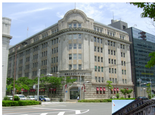
1922年に建てられた 石造りの建物

神戸市中央区の旧居留地にある商船三井ビル1、2Fに立地。公共交通機関でもお車でも、交通の利便性が非常に高い立地です（大丸の駐車場を利用可）。252坪という新宿店の2倍以上の広さを誇る店舗は、吹き抜け構造で内装もラグジュアリー。約60ブランドを取り扱うとともに、現行の2500本以上の試打クラブを取り揃え、フィッティングしての販売をメインに展開していきます。