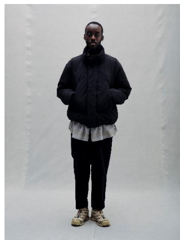
PADDED JACKET ¥21,990 FLANNEL SHIRT ¥11,990 CORDUROY PANTS ¥9,999