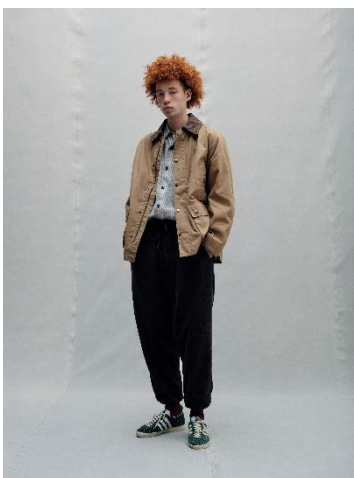
FIELD JACKET ¥16,990 FLANNEL SHIRT ¥11,990 FLEECE PANTS ¥7,999