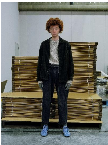
CORDUROY JACKET ¥12,989 CREW NECK KNIT ¥8,999 WORK PANTS ¥9,999