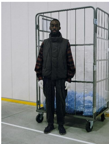
PADDED JACKET ¥21,990 FLANNEL SHIRT ¥11,990 CORDUROY PANTS ¥9,999