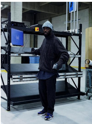
FLEECE JACKET ¥12,989 FLANNEL SHIRT ¥11,990 Twill SLACKS ¥8,999 KNIT CAP ¥2,990 MITTENS ¥3,990