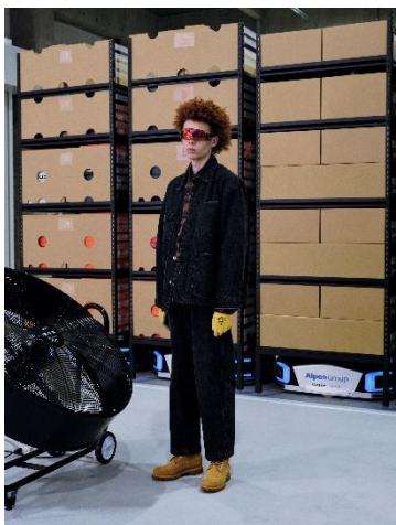
COVERALL JACKET ¥18,990 FLANNEL SHIRT ¥11,990 WORK PANTS ¥9,999