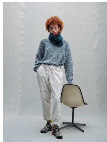
CREW NECK KNIT ¥8,999 CORDUROY PANTS ¥9,999 NECK WARMER ¥5,999