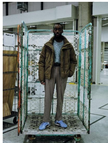
PADDED JACKET ¥21,990 CREW NECK KNIT ¥8,999 Twill SLACKS ¥8,999