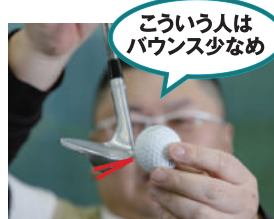
こういう人は バウンス少なめ ハンドファースト弱め、入射角 がゆるやかな人はバウンス少な めが合う