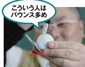
こういう人は バウンス多め ハンドファーストが強め、入射 角が鋭角な人はバウンス多めが 合う