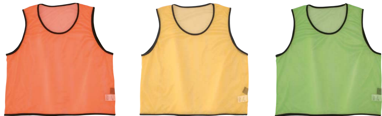
オレンジ イエロー グリーン