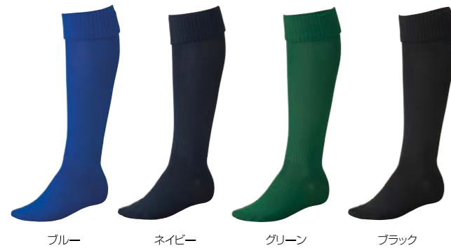
ブルー ネイビー グリーン ブラック