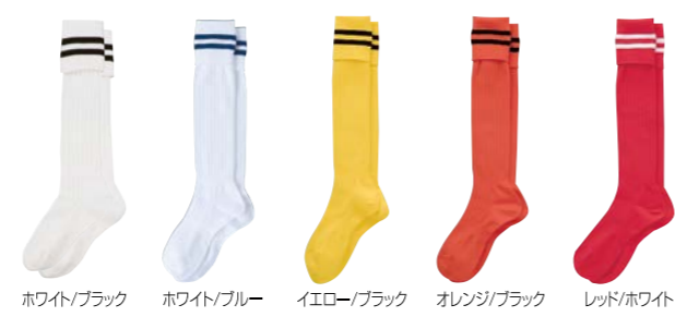
ホワイト/ブラック ホワイト/ブルー イエロー/ブラック オレンジ/ブラック レッド/ホワイト

■素材:ポリエステル100% ■日本製 大人用 本体価格¥648 税込¥712 TR-8SA1109 サイズ:25~27cm ジュニア用 本体価格¥648 税込¥712 TR-8SA4109 サイズ:16~18cm・19~21cm・22~24cm