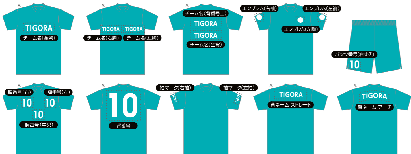
※印はスペシャルプライス対応商品です。

左記マークリストに記載のマーク位置であれば、いくつマーク位置を選んでも 無料 です。 (ユニフォームシャツ・ユニフォームパンツ・ゴールキーパーシャツの価格にマーク加工料金は含まれています。)