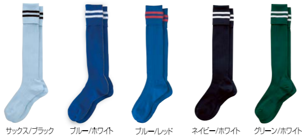
サックス/ブラック ブルー/ホワイト ブルー/レッド ネイビー/ホワイト グリーン/ホワイト

2本ラインストッキング ■素材:ポリエステル100% ■日本製 大人用 本体価格¥648 税込¥712 TR-8SA1119 サイズ:25~27cm ジュニア用 本体価格¥648 税込¥712 TR-8SA4119 サイズ:16~18cm・19~21cm・22~24cm ブラック/ホワイト ブラック/レッド ※大人サイズのみ シルバー/ブラック