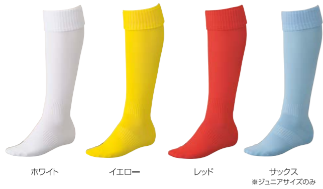
ホワイト イエロー レッド サックス ※ジュニアサイズのみ